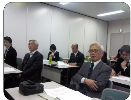
議長の言葉に耳を傾ける会員

その後、速やかに支部長以外の支部役員案が執行部より提出され、新しい役員が決まりました（新役員については支部5月定例理事会において、各担当が決まりました。詳しくは右ページに別途記載）。